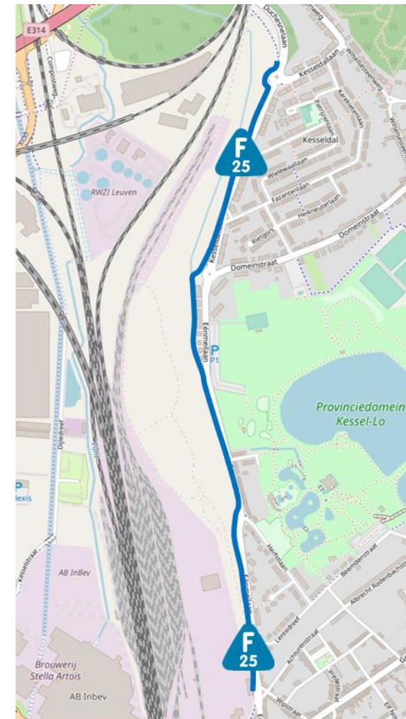
Projectgebied F25 deelproject Kessel-Lo